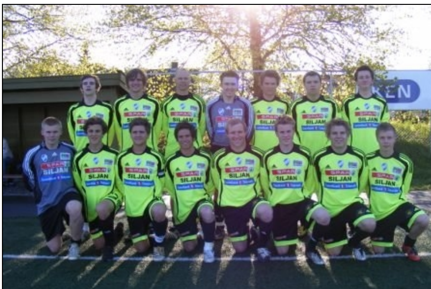
Siljan A-lag 2009

innbyggere til å komme å støtte opp på denne kvelden. Til lagledere og trenere så vil det bli en intern konkurranse mellom lagene på hvem som kan stille med størst andel av spillerne sine. Vinneren vil bli premiert.